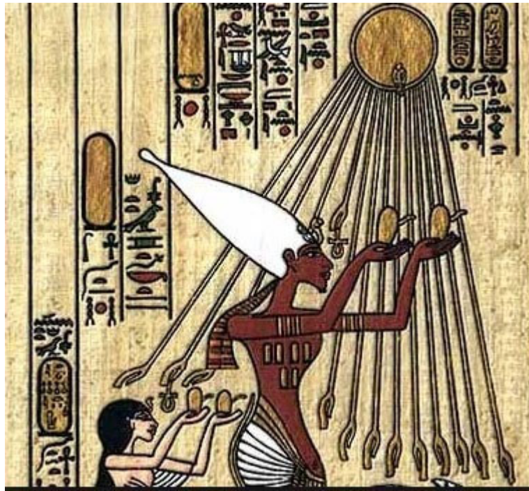
rappresentazioni egiziane che mirano il sole

Nel 2015 I produttori dei Cilindri egiziani russi, incuriositi da alcuni geroglifici in cui sembra che i Cilindri siano associati ai raggi solari, hanno chiesto ad alcuni Sun Gazers Canadesi di provare ad effettuarla utilizzando, durante la fase di osservazione diretta del sole, i Cilindri Egiziani.